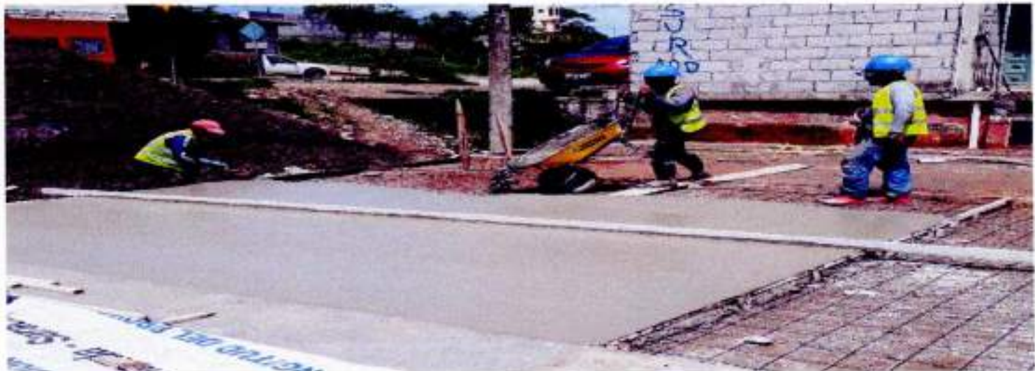
COLOCADO DE HORMIGÓN EN PAÑO DE PISO.