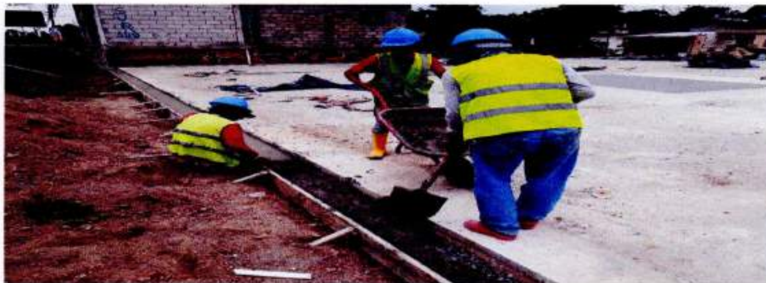
FUNDIDO DE CUNETETA PARA DESALOJO DE AGUAS LLUVIAS – NO CONTRATADO