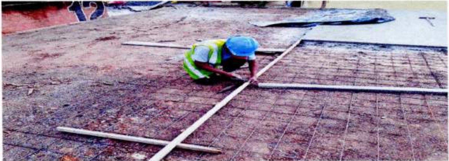
COLOCACIÓN DE TIRAS EN PAÑOS