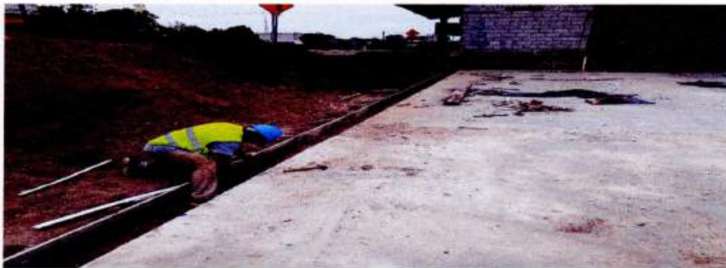
ENCOFRADO DE CUNETETA PARA DESALOJO DE AGUAS LLUVIAS – NO CONTRATADO