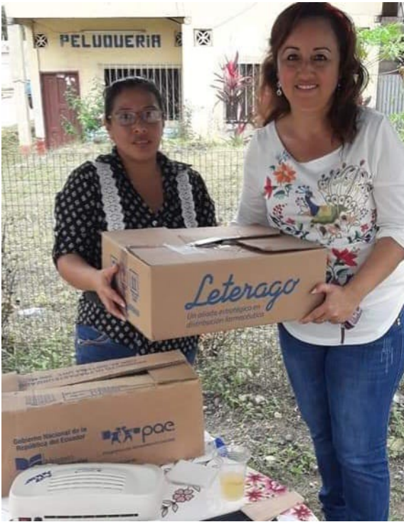
Atendiendo a ciudadanos agricultores.