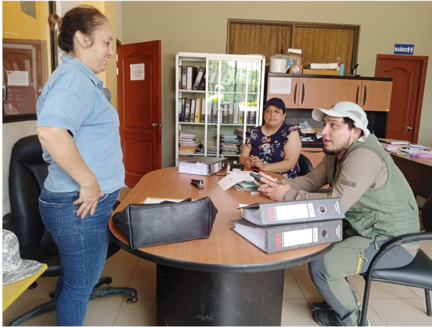
Trámites en el Seguro de la Institucionalidad.