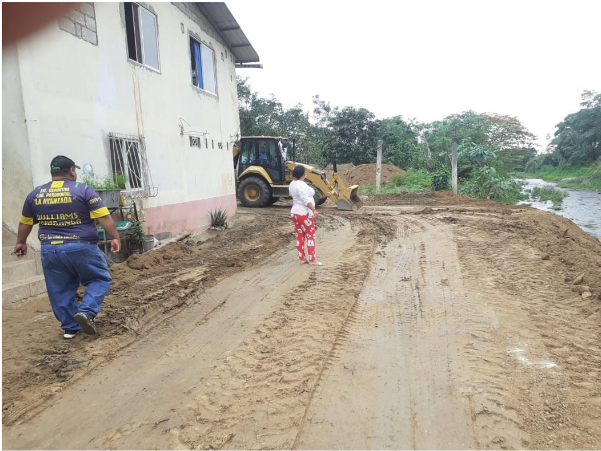
Máquina trabajando en escollera, realizados por la Dirección de Riego de la Prefectura de El Oro.