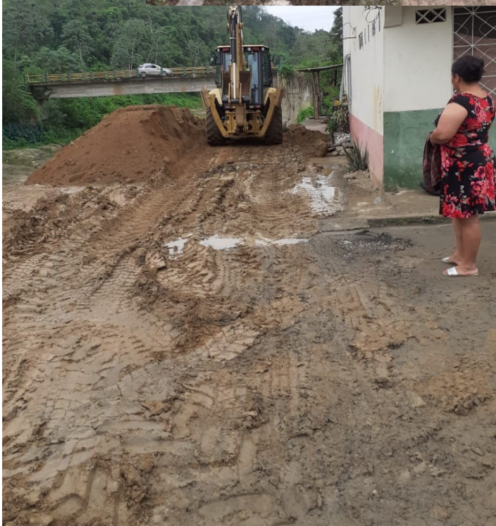
Tendido de material arcilloso sobre escolleras, con maquinarias de la Prefectura.