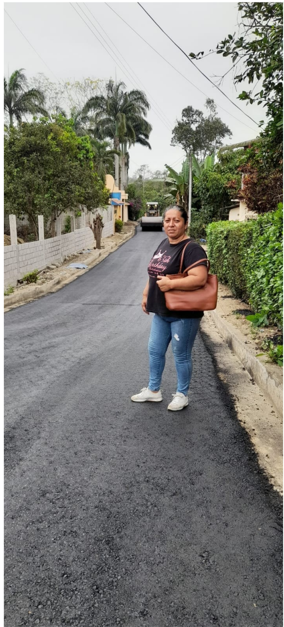
Maquinaria trabajando en la calle paralela del GAD Parroquial.