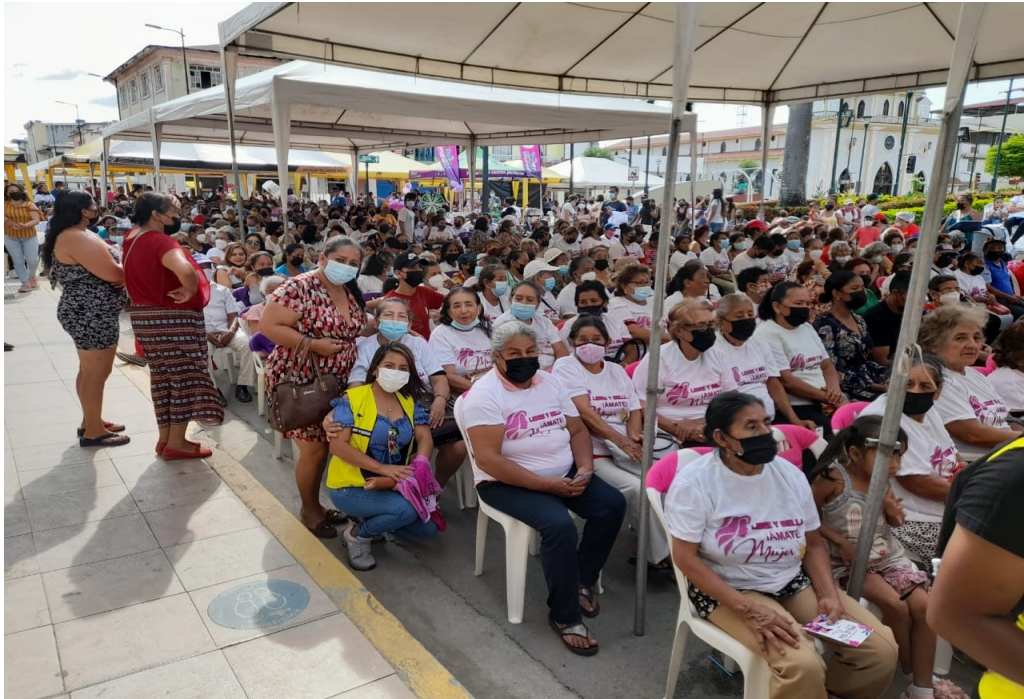
Entrega de uniformes a promotoras de CDI