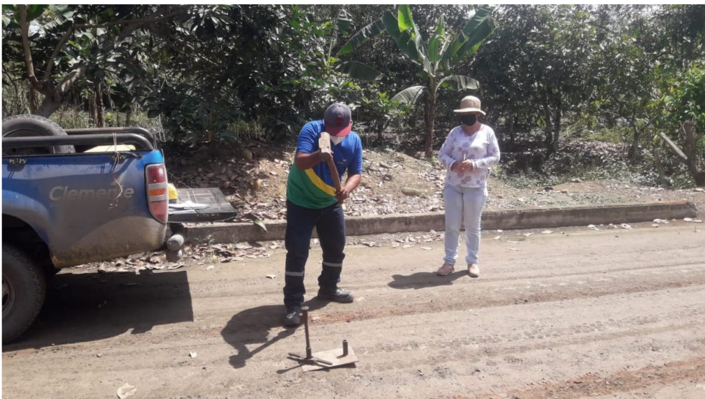
Fiscalización de extensión de red eléctrica para el Sitio de Limón Playas.

Junto a técnicos de la prefectura se realizó estudios de suelo para asfaltar la calle de la sede social hasta la cdla Trece de Abril.